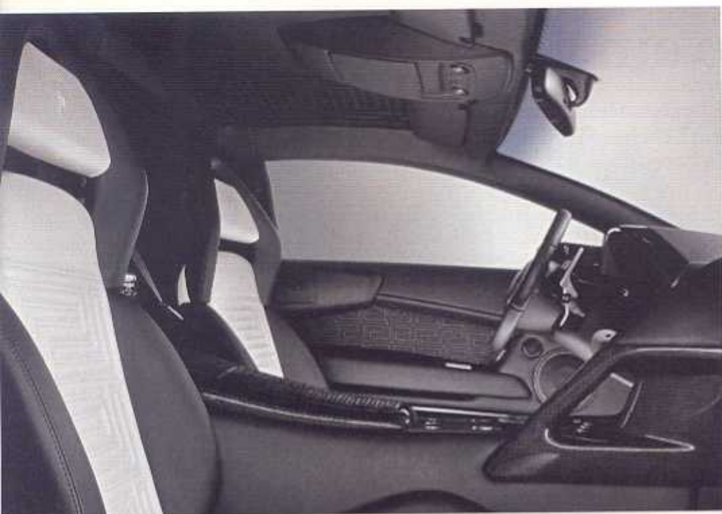
Most sexiest Sportwagen der Welt: Lamborghini Murciélago LP640 Versace.

Doch wer einmal im Leben zum Beispiel im dunklen Herzen Afrikas in einer schwierigen Lage steckt und Hilfe braucht, dürfte es bereuen, eine Portugieser von IWC, eine Louis Brandt von Omega oder sonst eine tolle Uhr zu tragen, falls er den Eingeborenen einen Tauschhandel vorschlagen möchte. Mit einer Submariner oder einer Daytona am Arm – «no problem, boss».